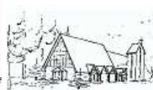
St. Elisabeth, Norddorf