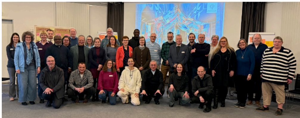
Die Teilnehmergruppe mit Erzbischof Heße (Mitte vorn)